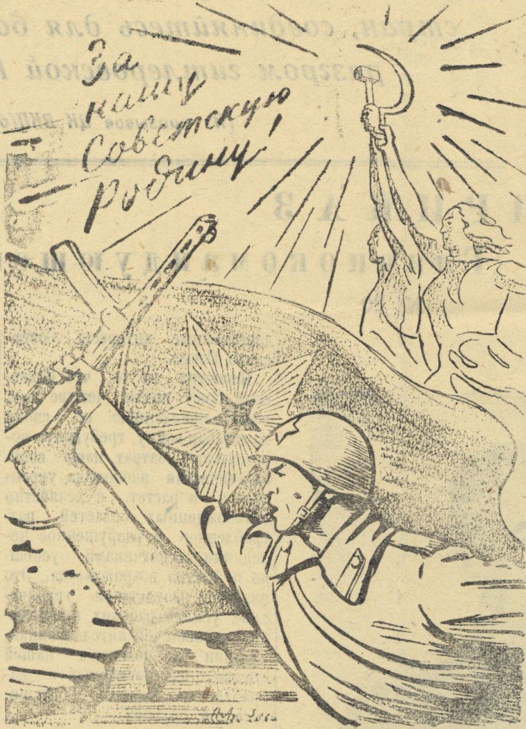
Рисунок художника Н. Аввакумова.

Торжественные заседания, посвященные празднованию Первого Мая, прошли вчера также в Морозовском, Нижне-Кулойском и других сельсоветах и колхозах района.