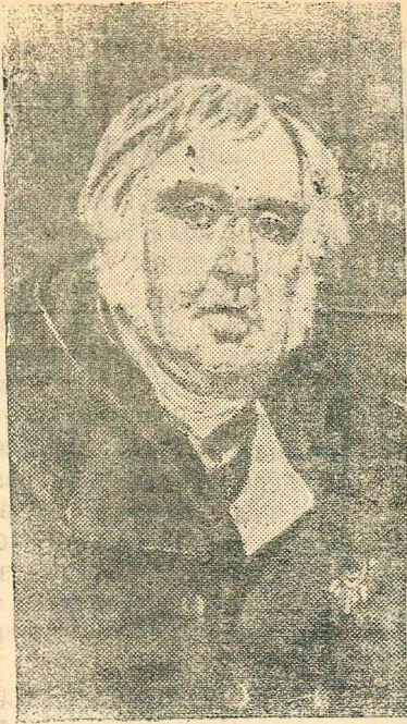
НА СНИМКЕ: Иван Андреевич Крылов (1767—1844), баснописец—сатирик, создатель русской басни.

После обсуждения итогов пленума Обкома ВКП(б) собрание партактива приняло раз- вернутое решение.