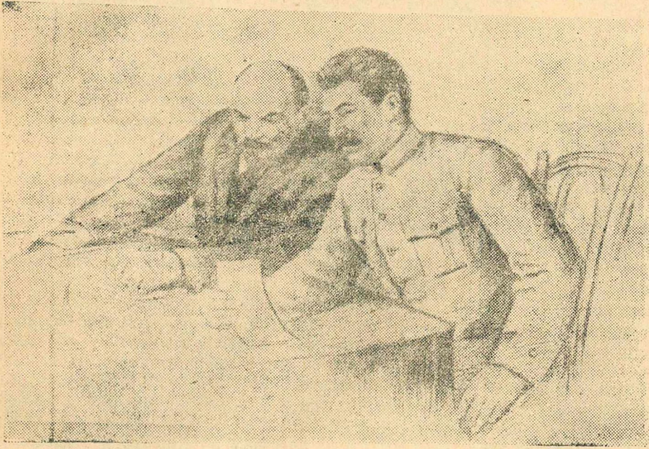
ЛЕНИН И СТАЛИН.

(Из Государственного Гимна Советского Союза).