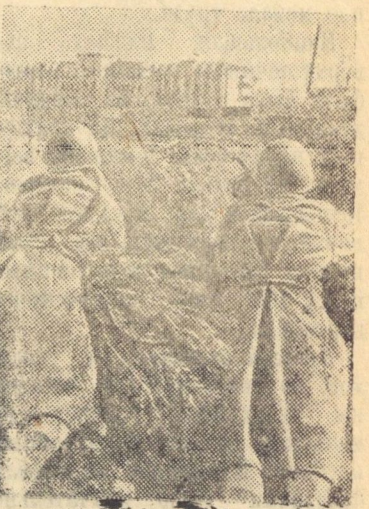
На снимке: Автоматчики обстреливают засевших в соседних кварталах немцев.