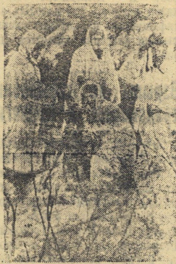
Действующая Армия (Западный фронт)

Минометчики подразделения лейтенанта Кирильцева ведут огонь по врагу на дальних подступах к Москве.