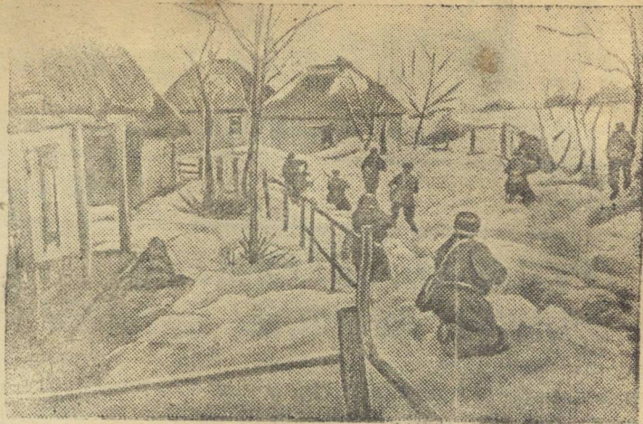
Бойцы Н-ской части выбивают немцев из села Н.