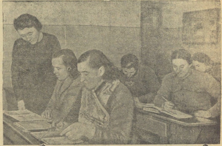
Учительница 30-й неполной средней школы г. Риги В. Штал занимается с неграмотными.