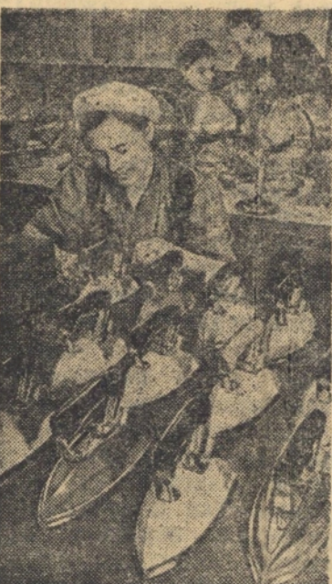
Цех бытовых электроприборов Московского машиностроительного завода освоил производство разноцветных эмалированных утюгов с красивой внешней отделкой.

ветных радио-и телефонных узлов, освещения больших помещений. (ТАСС)