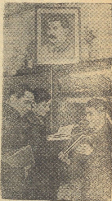
В бывшем имении помещика (Каунасский уезд) открылась библиотека для крестьян.