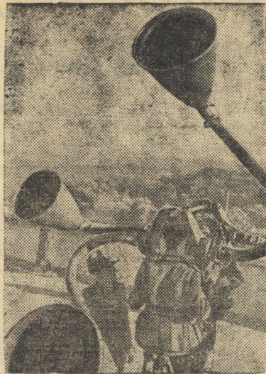
Итальянский звукоулавливатель, установленный близ Неаполя (Италия).

Германский бюллетень „Динст аус Дейчланд“ опубликовал на днях статью о германо-французских отношениях. „Договор о перемирии, — говорится в статье, — не означает прекращения военного конфликта между Германией и Францией, а создает только необходимые условия для продолжения войны между Германией и Англией на французской почве“. Бюллетень указывает далее, что Петэн в свое время при переговорах с Гитлером выразил желание сотрудничать с Германией. В качестве проводника намечавшегося германо-французского сотрудничества французским правительством был выдвинут тогдашний министр иностранных дел Лаваль, который, однако, был очень скоро удален из состава правительства. „С тех пор, — пишет бюллетень, — с германской стороны к политике Виши относятся с большими сомнениями, отнюдь не скрывающая этого“. (ТАСС)