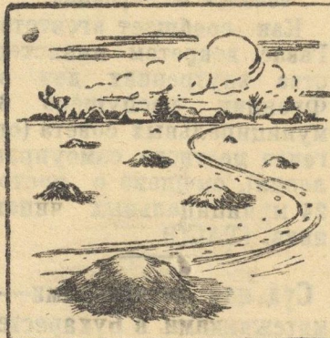
Как не надо складывать навоз в поле.

Навоз в поле при зимней вывозке должен укладываться в большие штабеля,