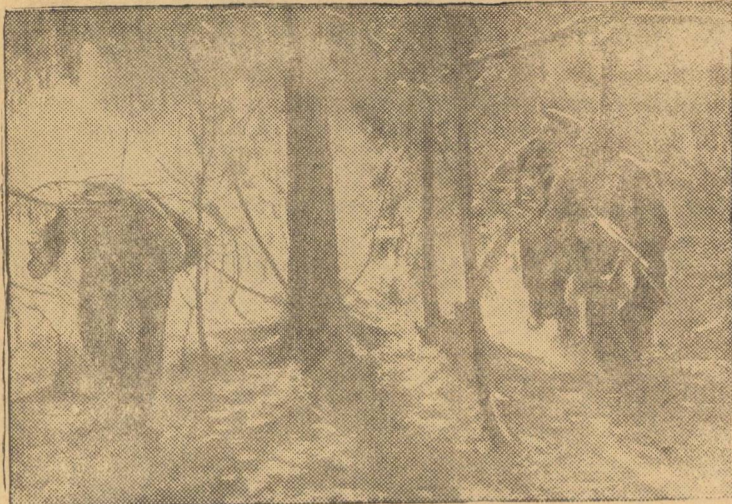
Действующий Краснознаменный Балтийский Флот Десант балтийцев, высадившийся на вражеском острове, «прочесывает» лес.