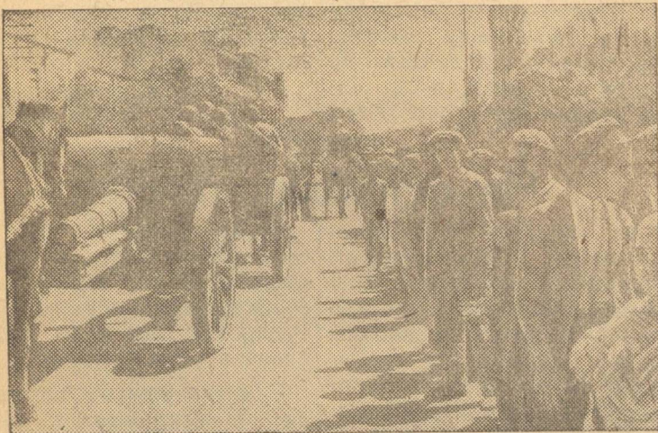
Советские войска в Иране

Активно участвует молодежь и в других оборонных мероприятиях, помогая фронту.