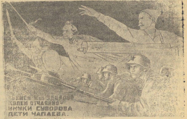
Рисунок художников Кукрыниксы. Текст С. Маршака. (Репродукция с плаката, выпускаемого издательством «Искусство»)

Советская авиация имела полную возможность систематически бомбить Берлин в начале и в ходе войны. Но командование Красной Армии не делало этого, считая, что Берлин является большим столичным городом, с большим количеством трудящегося населения, в Берлине расположены иностранные посольства и миссии, и бомбежка такого города могла привести к серьезным жертвам среди гражданского населения. Мы полагали, что немцы, в свою очередь, будут воздерживаться от бомбежки нашей столицы — Москвы. Но оказалось, что для фашистских извергов законы не писаны и правила войны не существуют. В течение месяца с 22 июля по 22 августа немецкая авиация 24 раза произвела налеты на Москву. Жертвами этих налетов явились не воен-