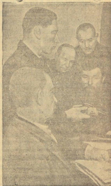
Группа старых рабочих, проживающих в доме № 14, на 3-ей Кожуховской улице (Москва), приступила к изучению стрелкового дела.

Такова картина действительного положения о потерях немецких и советских войск.