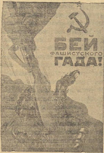
Рисунок художника Кокорекина (Репродукция с плаката, выпущенного издательством „Искусство“).

Наступило горячее время уборки богатого урожая трав. Надвигается уборка хлебов. Можно быть вполне уверенным, что трудовые колхозные книжки, выданные ученикам Козловской НОШ, не будут пусты. А. Кольцов