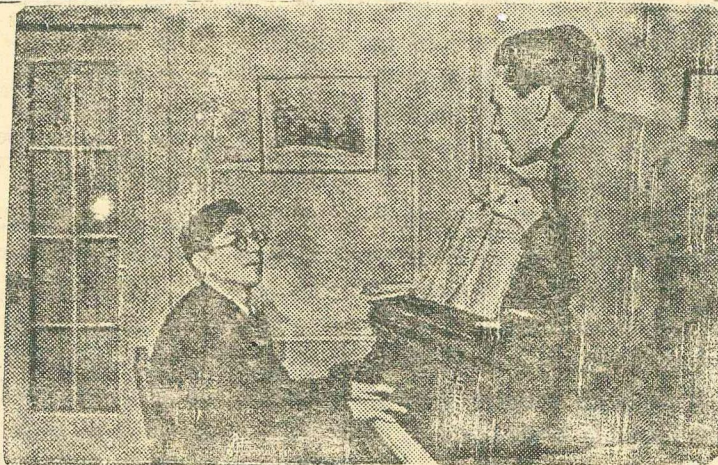
Лауреат Сталинской премии композитор В. П. Соловьев-Седой за годы войны написал около 60 песен, многие из них пользуются широкой популярностью. Почти все песни Соловьева-Седого написаны на слова поэта А. И. Фатьянова.

Сила тяги нового паровоза больше на 2,5 тонны по сравнению с серий Э и меньше на 1,8 тонны по сравнению с ФД. На девятичасовом подъеме, при скорости в 20 километров в час, паровоз повезет на 150 тонн груза больше, чем распространенный паровоз серии Э.