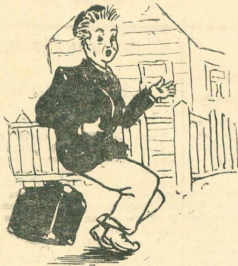
Где эта улица, где этот дом?

Кто из вас не испытывал радостного чувства при виде приветливых ярких огней на перроне незнакомой станции. Город, который от вас скрывает ночная темнота сразу кажется гостеприимным, даже родным. Вокзальные огни будто предсказывают удачу в ваших делах.