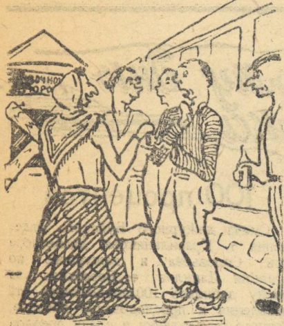
Цыганка: Позолоти, дорогой, ручку, разгадаю твою судьбу, про все расскажу.

На станции Кюноша справочное бюро не работает. Как только прибывает пассажирский поезд, его сразу же осаждают толпы цыганок. Тут же начинается галание. Милиция на это безобразия не обращает внимания.