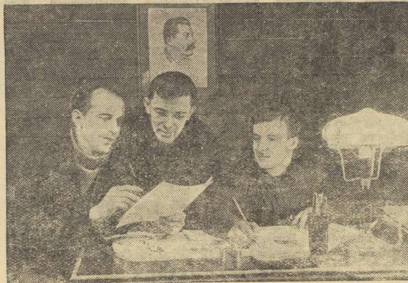
Стенгазета «Стахановец» — паровозного депо Бабаево — лучшая на Бабаевском узле.

Так из номера в номер газета разоблачает жуликов и бюрократов,