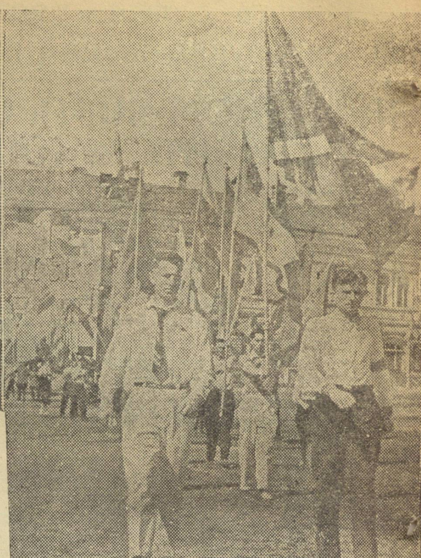
Празднование 1 мая в Вологде. На снимках: Слева—велосипедисты—учащиеся школ города, в центре—колонна учащихся Вологодского железнодорожного училища № 1, справа—знаменосцы спортивных обществ города на первомайской демонстрации.