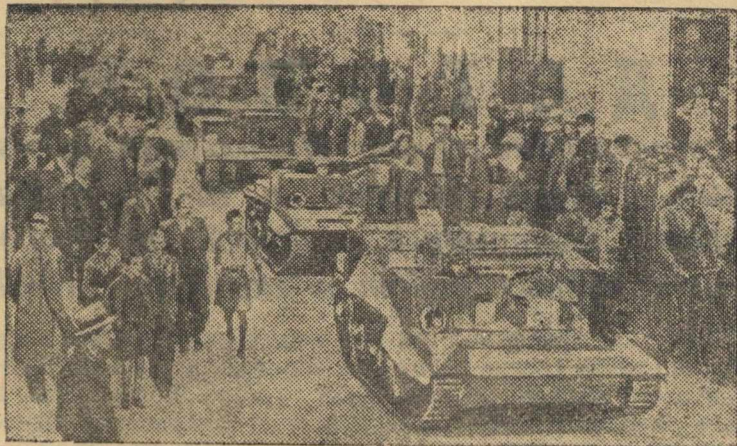
Английские танки в Греции.