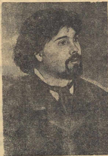
В. И. Суриков (с портрета художника И. Е. Репина, 1887 г.)

К 25-летию со дня смерти (19 марта 1916 г.) знаменитого русского художника В. И. Сурикова.