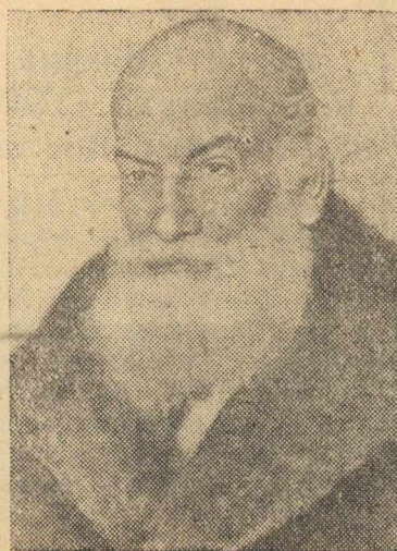
Н. Е. Жуковский.

17 марта исполнилось 20 лет со дня смерти ученого с мировым именем „отца русской авиации“ Н. Е. Жуковского— основателя Военно-Воздушной Академии в Москве.