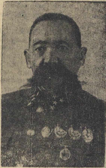
Генерал-полковник О. И. Городовиков.

Сил достаточно. При большевистской настойчивости, инициативе сельская интеллигенция может выполнить большую и почетную задачу в деле внедрения культуры в нашей советской деревне.