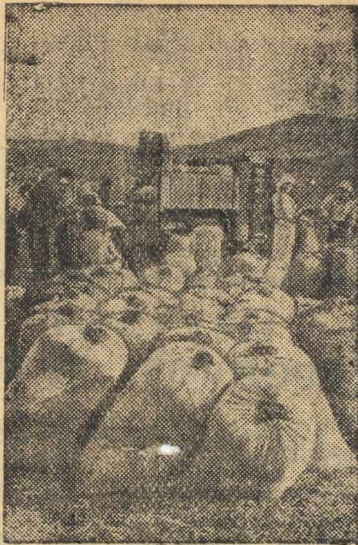
Колхоз имени О К Д В А (Спаский район. Приморье) первый в районе полностью рассчитался с государством по хлебопоставкам.