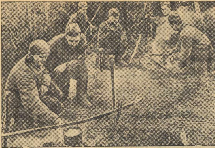
Красноармейский отряд, действующий в тылу противника, на привале. Слева—местная жительница готовит бойцам обед.