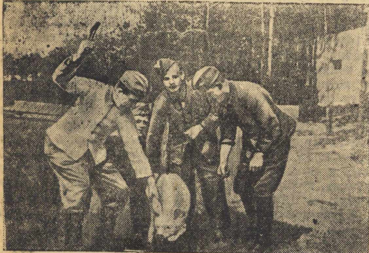
На этом снимке, найденном у убитого громилы, изображена компания фашистских мародеров, забивающая свинью, отнятую у колхозников. Свою „доблесть“ они постарались увековечить снимком.

На территории советских районов, временно занятых немцами, идет безудержный грабеж. Немецко-фашистские солдаты забирают у жителей сел и местечек все ценное, режут скот, грабят магазины. Фашистское командование всячески поощряет мародерство и грабеж, поддерживая этим „моральное состояние“ своих войск.