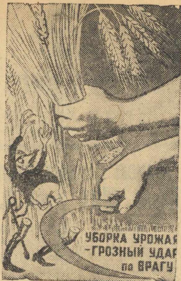
Рисунок худ. Кукурыныксы. (Репродукция с плаката, выпущенного издательством „Искусство“).