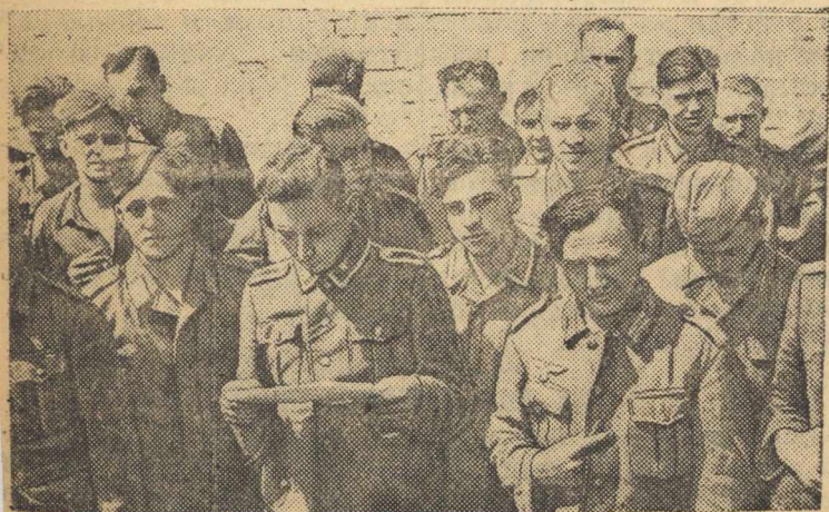
Группа пленных немцев.