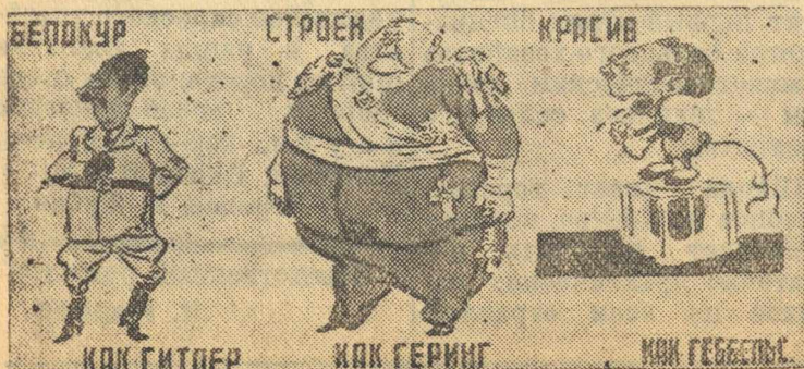
Рисунок В. Ефимова (Окно ТАСС № 22)

Согласно фашистской расовой теории истинный ариец должен быть: