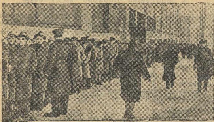
В ожидании работы в Нью-Йорке.