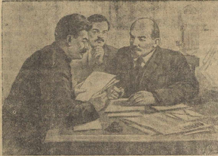
В. И. Ленин, И. В. Сталин и В. М. Молотов в редакции газеты „Правда“ — 1917 г.

Районная печать с 302 стенными газетами под руководством и непосредственным участием партийных организаций, партийного, советского, комсомольского, профсоюзного и колхозного актива выполняет исторические задачи, поставленные решениями партии и правительства и выведут район в передовые районы области.