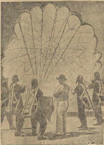
Обучение парашютистов приемам владения парашютом в момент приземления.