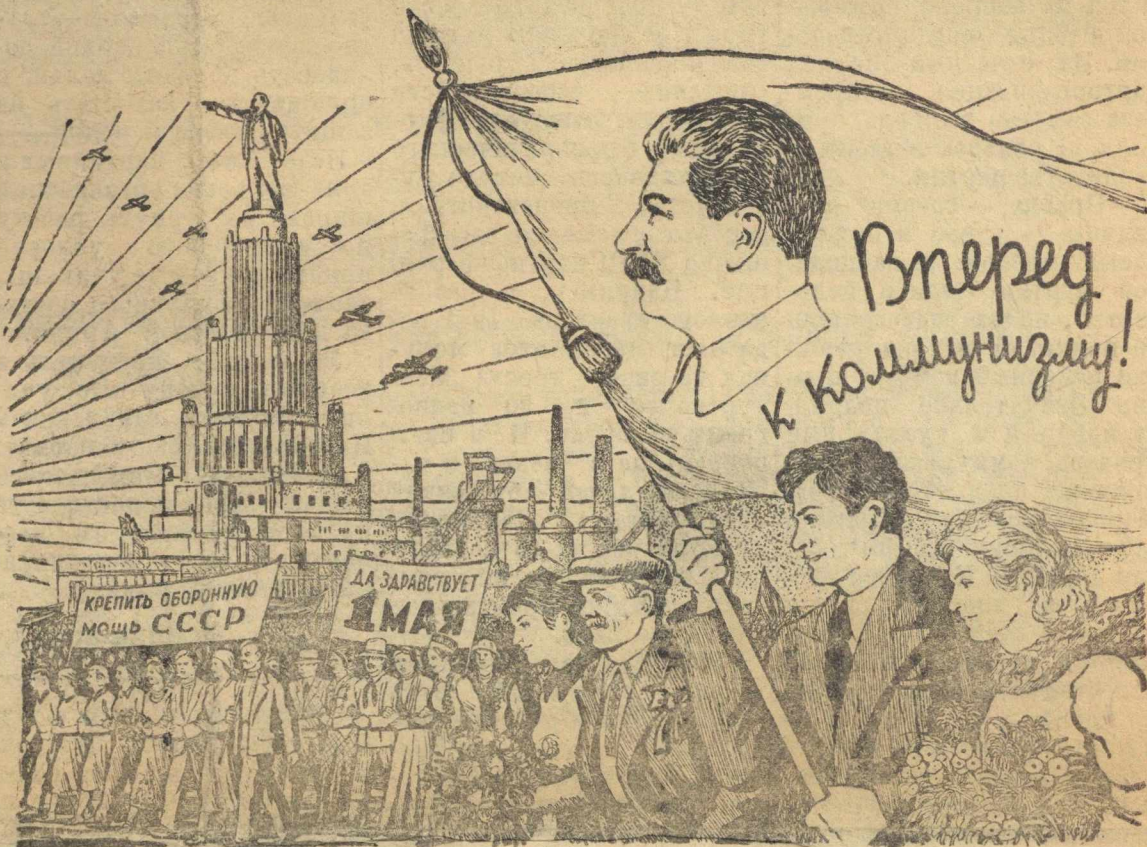
Рисунок Б. Уханова