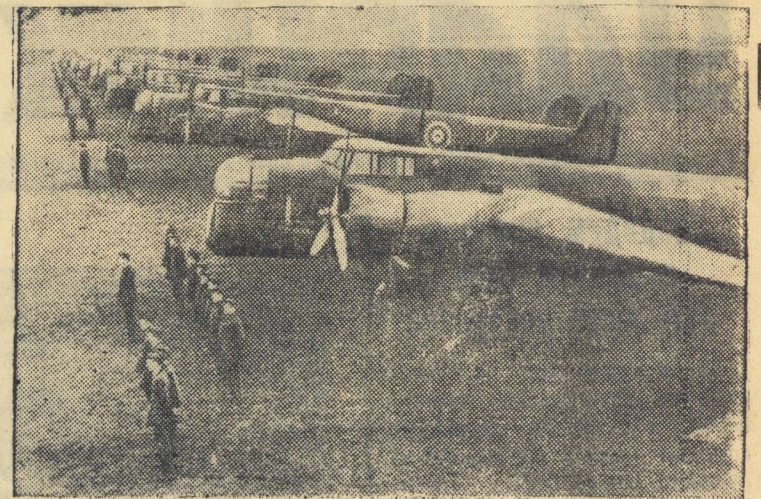
Бомбардировщики «Мерлин» на старте. Фотохроника ТАСС.