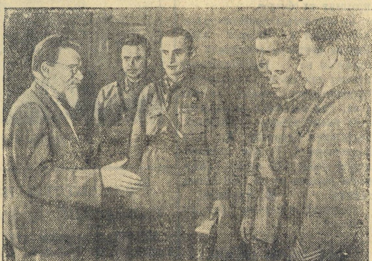
Товарищ М. П. Калинин беседует в Кремле с героями-летчиками, награжденными орденами и медалями СССР за образцовое выполнение боевых заданий Командования на фронте борьбы с германским фашизмом и проявленные при этом доблесть и мужество.

Не забывайте, товарищи колхозники, что Красная Армия требует от нас больше продукции и мы ее должны дать в полной мере.