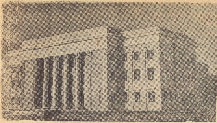
Новый дом культуры Сегежского целлюлозно бумажного комбината (Карело-Финская ССР)