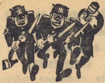
ФАШИСТСКАЯ ОПЕРАТИВНАЯ С ВОДКОЙ