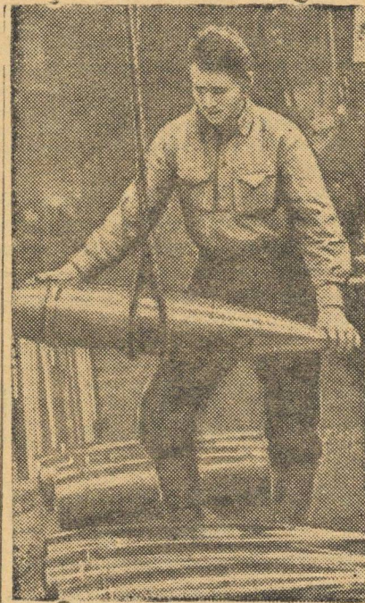
На Н-ском заводе в Ленинграде день и ночь делают снаряды для фронта.