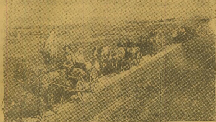
Крестьяне села Табаны, Бричанского района, Бельцкого уезда, Молдавской ССР, везут хлеб государству к годовщине освобождения Молдавии крестьяне этого села полностью выполняли свои обязательства по поставкам зерна государству.

Колхозники и колхозницы, работая машинно-тракторными станциями! Родина ждет от вас выполнения выданных обязательств в соревновании,—выполнения плана хлебоборьбы к 5 октября 1945 года.