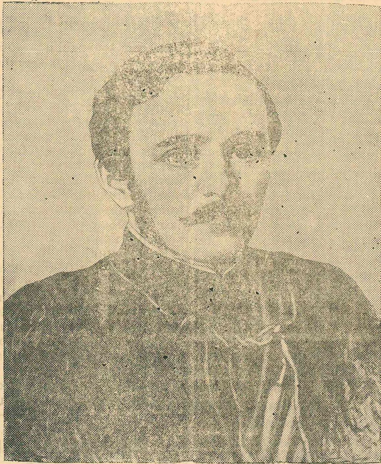
Михаил Юрьевич Лермонтов.

Но Лермонтова всегда питала вера в будущее своей родины. В своей записной книжке он сравнивал Россию с Ерусалом Лазаревичем из народной сказки, который побил тридцать семь королей и семьдесят богатырей.