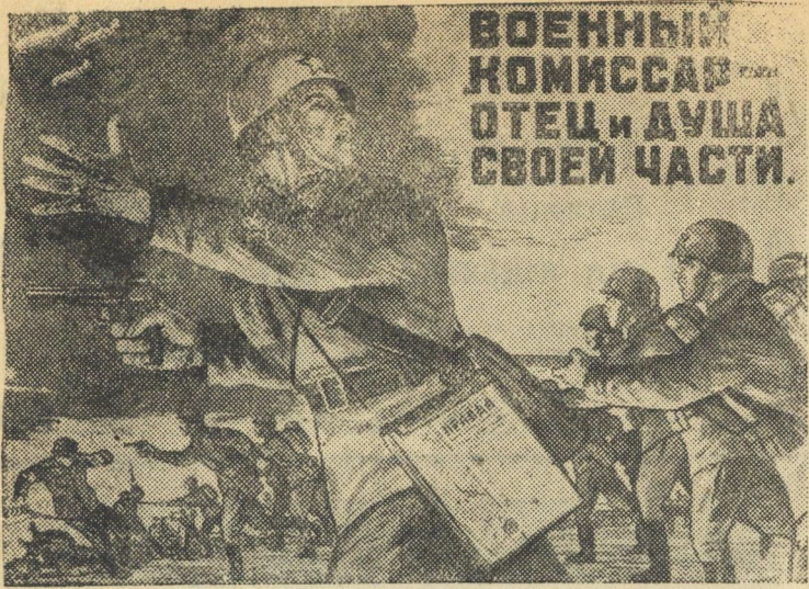
Рисунок художника Мальцева.

(Репродукция с плаката, выпускаемого издательством „Искусство“)