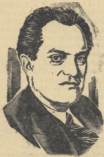
В. В. Куйбышев

С 1922 по 1923 г. г. он один из секретарей Центрального Комитета партии, ближайший помощник товарища Сталина. На X съез-