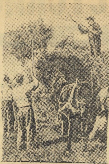
Уборка клевера на участке Чимкентского плодового питомника.