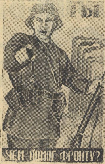
Рисунок художника Моор. (Репродукция с плаката, выпускаемого издательством „Искусство“).