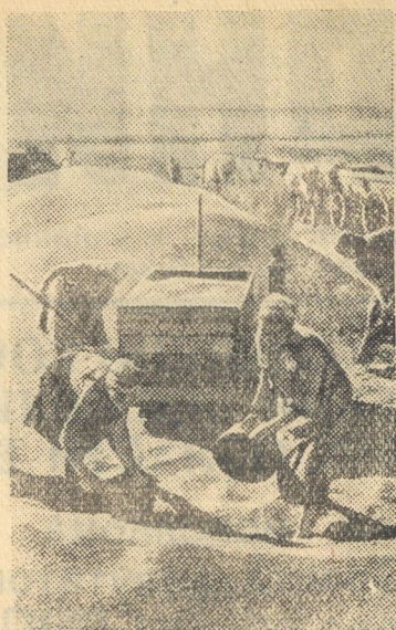
Взвешивание зерна нового урожая на току колхоза „Первая Алексеевка“ (Мустаевский район, Чкаловская область).