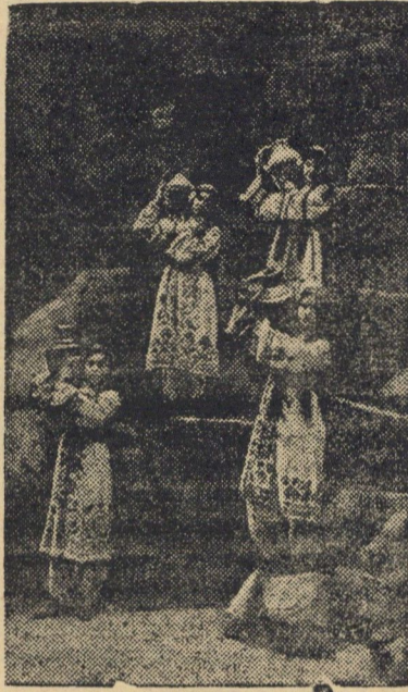
Сцена из 1-го акта музыкального представления „Дола“ в постановке Таджикского государственного театра оперы и балета (Сталинабад).

Весной 1941 года в Москве будет проведена декада таджикского искусства. В декаде готовится ряд постановок: музыкальное представление „Дола“ оперы „Восстание Восе“ и „Кузнец Кова, первый таджикский балет „Ду Гуль“, драма „Краснопалочники“ и трагедия Шекспира „Отелло“.