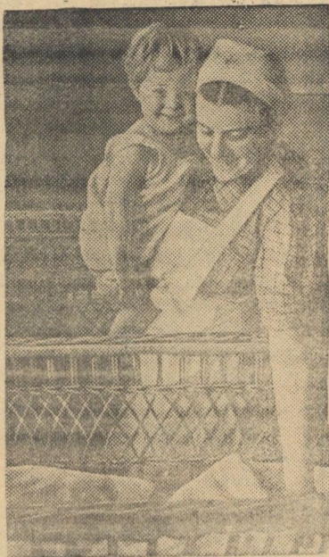
В новых детских яслях № 1 в г. Каунасе.

С установлением Советской власти в Литве введено социальное страхование, бесплатная медицинская помощь. Открываются десятки новых детских яслей, датеядов, поликлиник, амбулаторий, родильных домов и т. д.