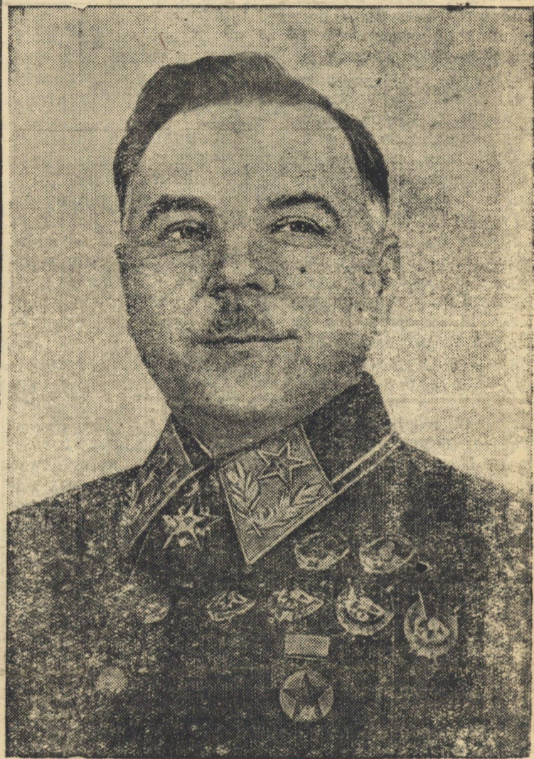
Заместитель Председателя СНК СССР, Маршал Советского Союза К. Е. Ворошилов.

Горячо поздравляя Климента Ефремовича с днем его 60-летия, рабочие, крестьяне, интеллигенция, бойцы и командиры Красной Армии, — весь советский народ, — желают ему долгих лет жизни и здоровья на радость трудящимся.