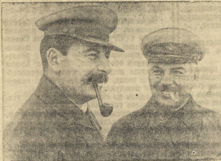
И. В. Сталин и К. Е. Ворошилов (1935 г.)

За последние годы, в период, когда армия организационно и технически заново перевооружалась, становилась все более крепкой и могущественной силой (Продолжение на 3 стр.)