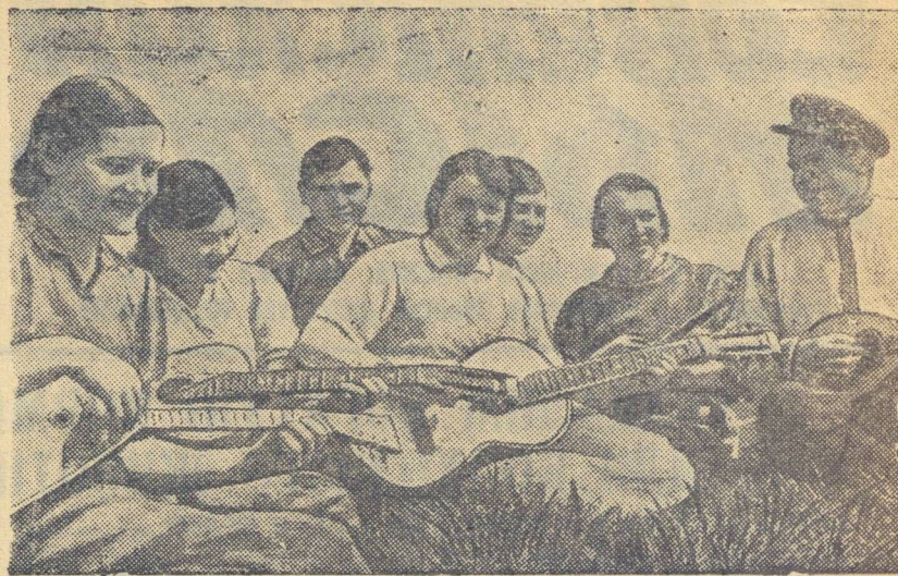
В часы отдыха.

НЬЮ-ЙОРК, 21 июня. (ТАСС). Как передает агентство Юнайтед Пресс, законодательное собрание Панамы приняло резолюцию, в которой призывает правительство порвать дипломатические отношения с франкистской Испанией и установить отношения с Советским Союзом.