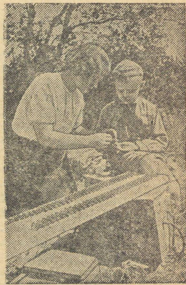
Боевые подруги командиров Н-ской части овладевают пулеметным делом.

На снимке: За подготовкой пулеметной ленты.