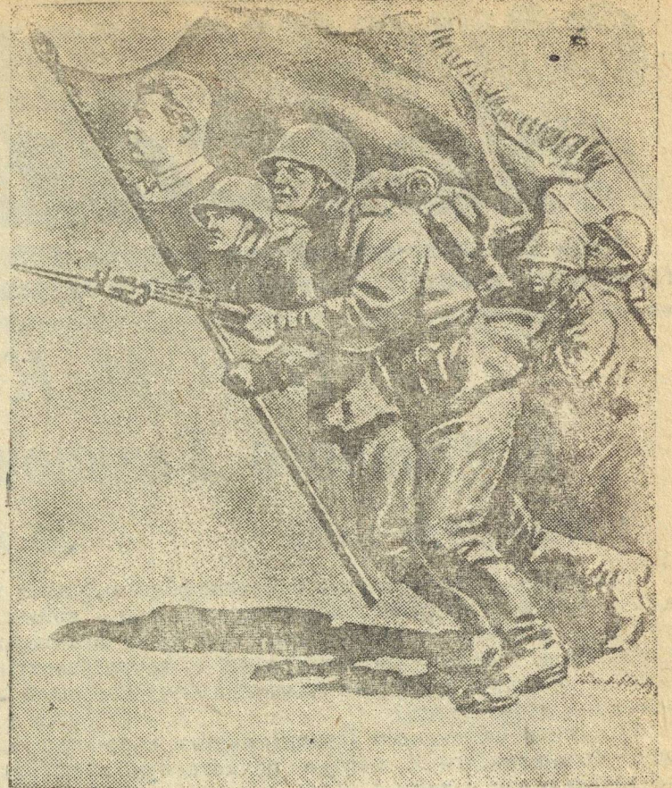
Вперед, за разгром немецких оккупантов!

Зав. отд. пропаганды и агитации РК ВКП(б)