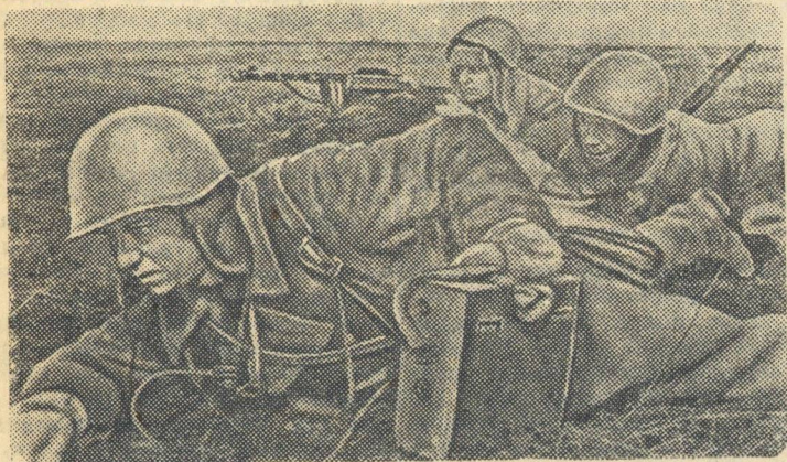
Связист на поле боя.