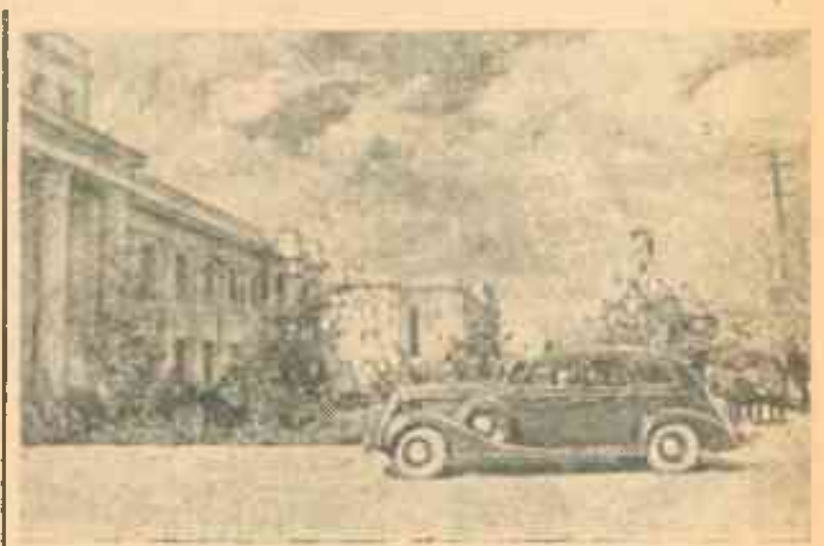
По городам Советского Союза.

На снимке: Улица Лахути в городе Сталинабаде.