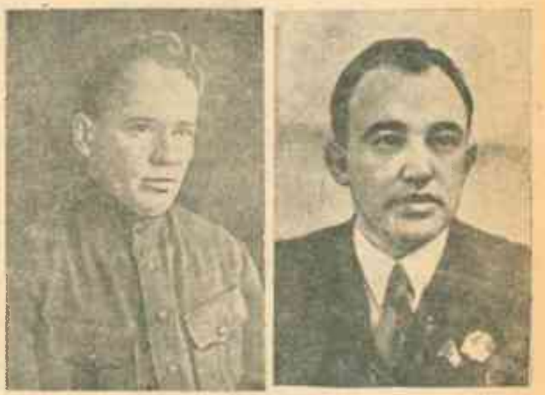
Сталинские лауреаты. Им присуждены Сталинские премии первой степени. На снимке: (слева направо) М. А. Шолохов — писатель, действительный член Академии Наук СССР и А. Е. Корнейчук — драматург.

В Риге открылся первый районный рабочий клуб. В клубе хранится красное знамя рабочих организаций Московского района, снесенное во время разгрома латвийских левых профсоюзных организаций в 1927 году. (ТАСС).