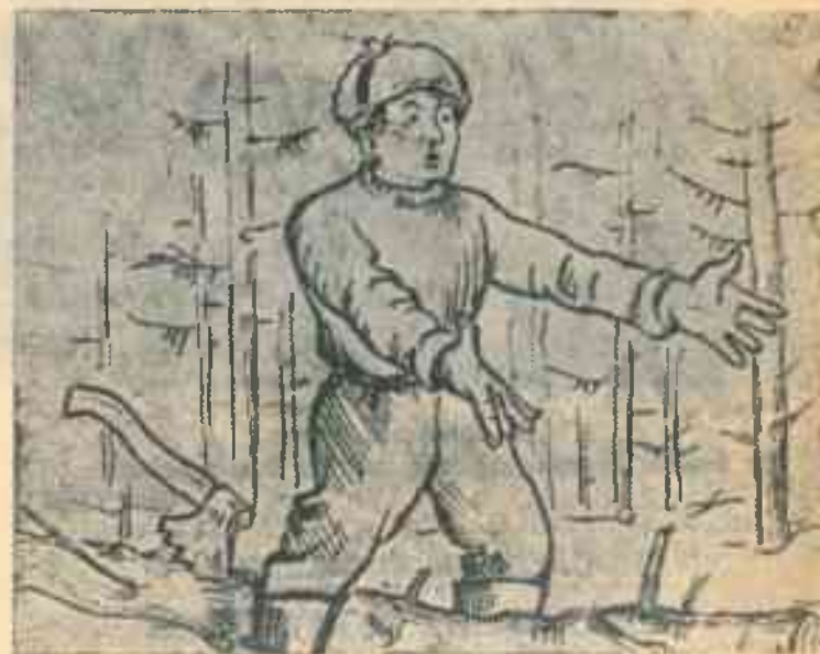
Рисунок П. Шарнина, текст К. Сопова.

(На популярный мотив — „Дайте в руки мне гармонию“)