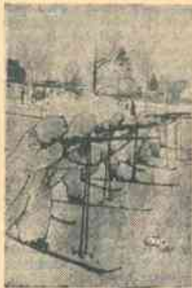
Зимние тактические занятия в Н-ской части МВО.

Так, за IV квартал минувшего года в члены ВЛКСМ принято в городе 176 человек, в районе—60.