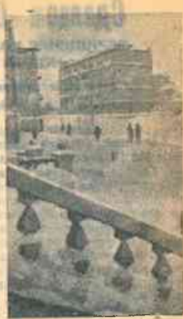
На снимке: Зима в г. Магадане (Хабаровский край).

ПАША СОСНОВСКИЙ, староста стрелкового кружка при Морозовской неполной средней школе.