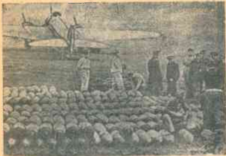
На албанском фронте. На снимке: Итальянская авиационная база в Албании.